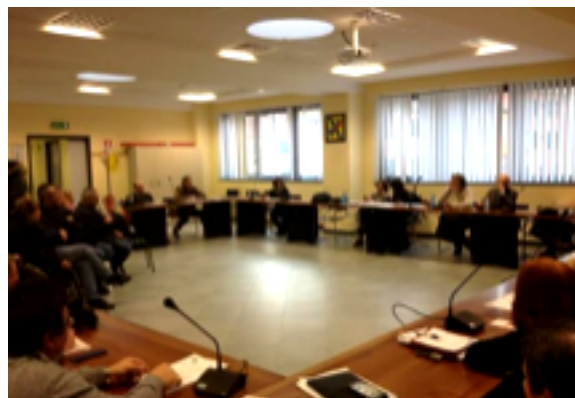
Molassana - L'impianto di separazione dei rifiuti di Volpara potrebbe essere chi...