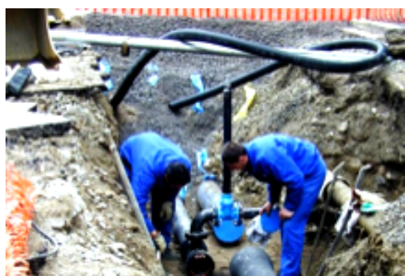
Genova - Molassana, giovedì