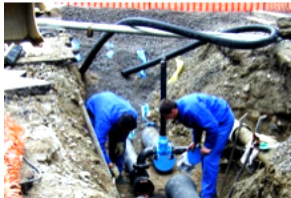
Genova - Molassana, giovedì niente acqua dalle 8 alle 17 per lavori alla rete