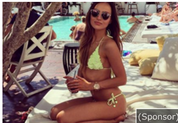
Wags: le più belle mogli dei calciatori!