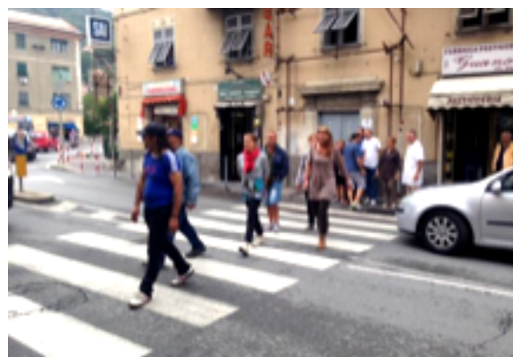
Genova - Molassana, la strana protesta dei commercianti che attraversano la stra...