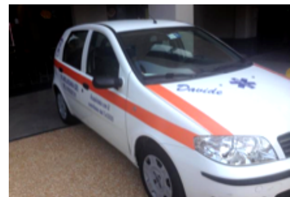
Molassana, inaugurata la nuova sede della pubblica assistenza