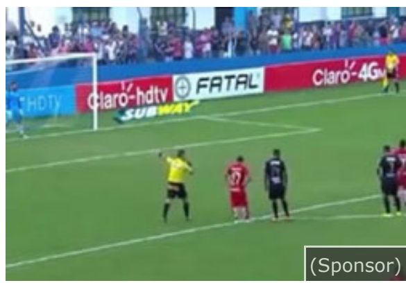
Guardate il calcio di rigore più incredibile della storia