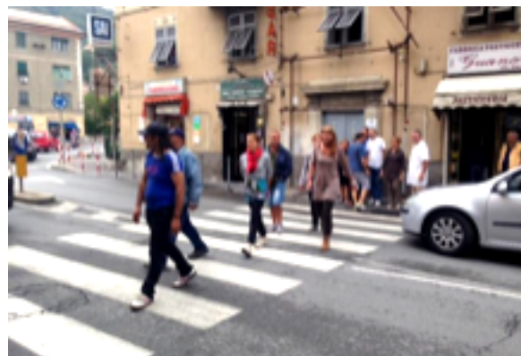
Genova - Molassana, la strana protesta dei commercianti che attraversano la stra...