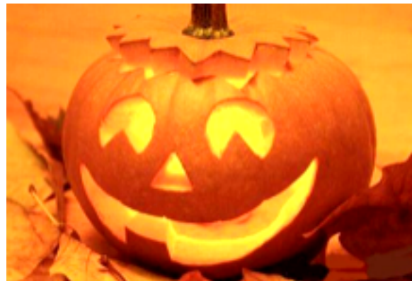
Cosa fare con i bimbi ad Halloween? Ecco alcuni appuntamenti in centro