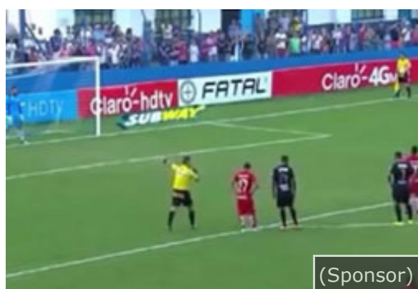
Guardate il calcio di rigore più incredibile della storia