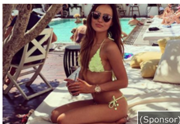
Wags: le più belle mogli dei